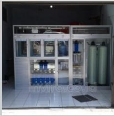
Desain Etalase (8)