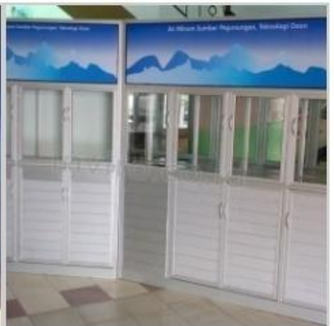
Desain Etalase (24)