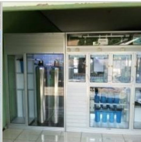
Desain Etalase (17)