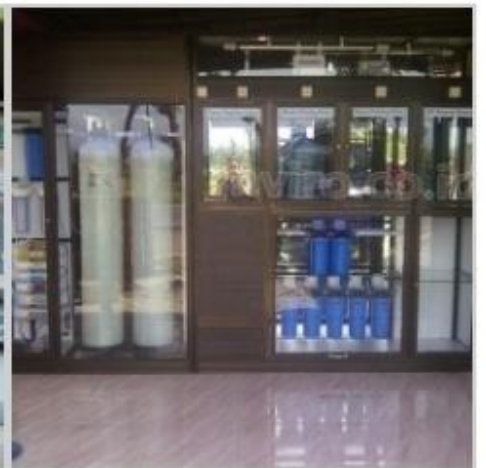
Desain Etalase (18)