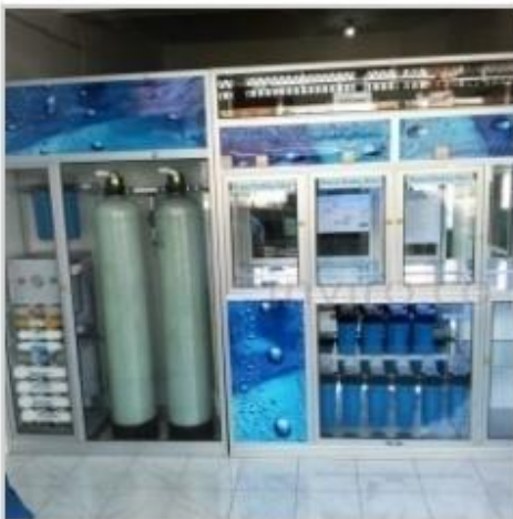
Desain Etalase (16)