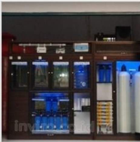
Desain Etalase (10)