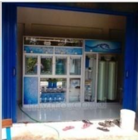
Desain Etalase (23)