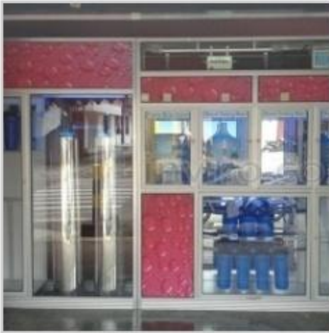
Desain Etalase (13)