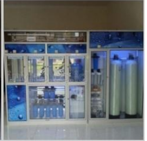
Desain Etalase (3)