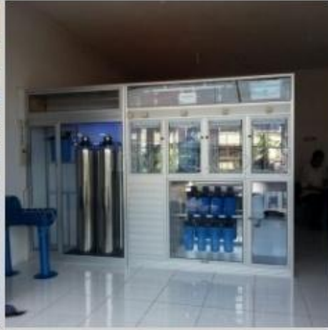
Desain Etalase (2)