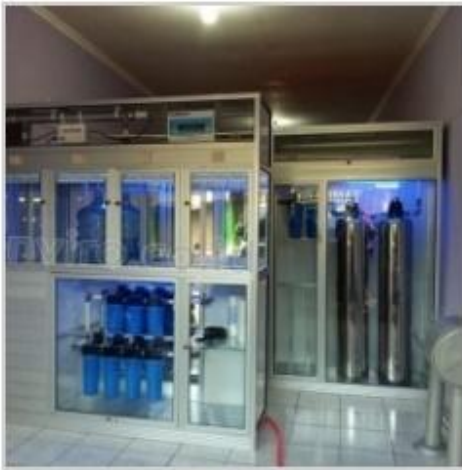
Desain Etalase (7)