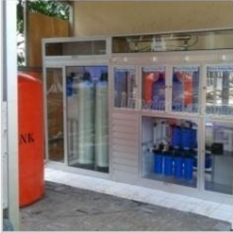
Desain Etalase (1)

Jika anda menghendaki resolusi gambar yang lebih besar, silahkan untuk menuju ke halaman website kami, tekan Ctrl + Klik DISINI >> http://inviro.co.id/desain-lemari-etalase-depot-air-minum-isi-ulang/