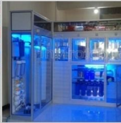
Desain Etalase (14)