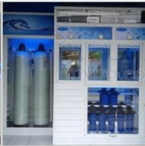
Desain Etalase (11)