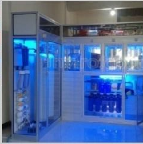
Desain Etalase (14)