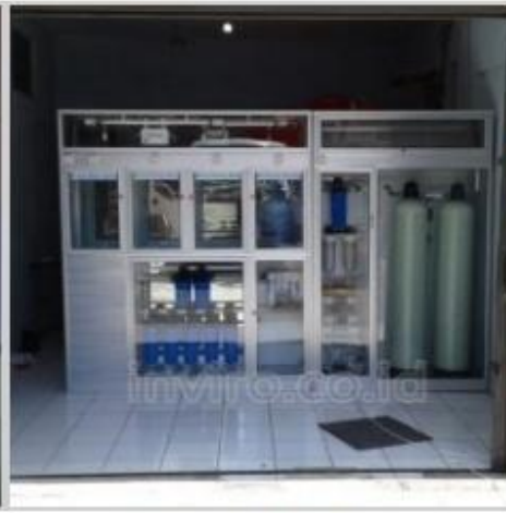
Desain Etalase (8)