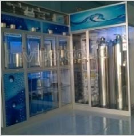
Desain Etalase (19)