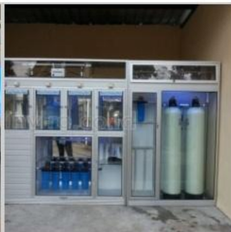
Desain Etalase (5)