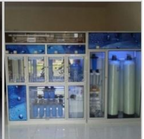
Desain Etalase (3)