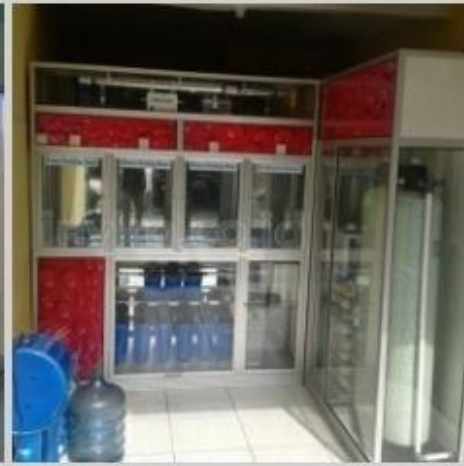
Desain Etalase (20)