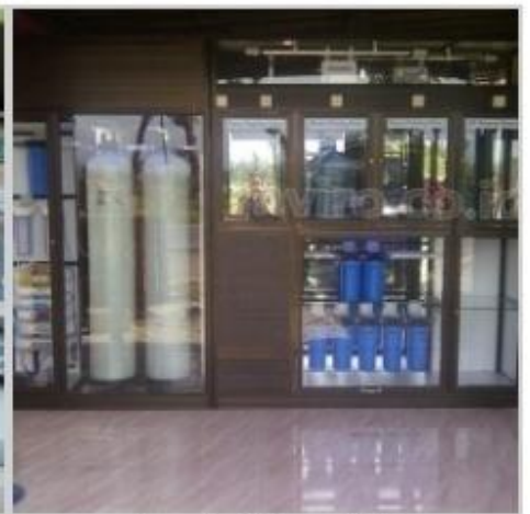
Desain Etalase (18)