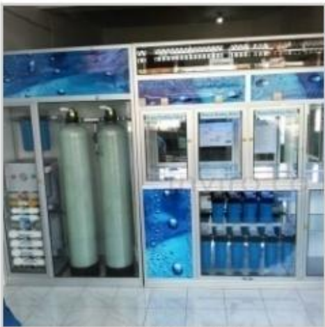
Desain Etalase (16)