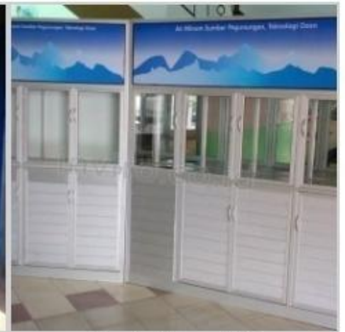
Desain Etalase (24)