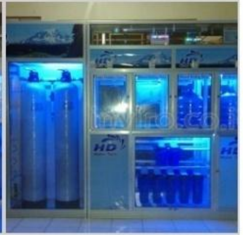
Desain Etalase (15)