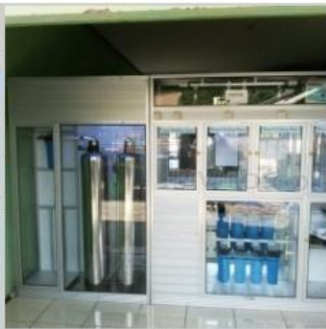
Desain Etalase (17)