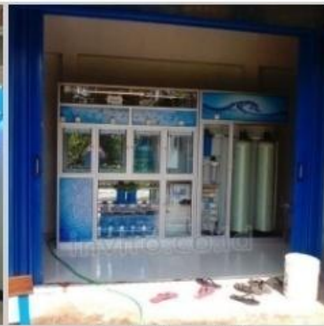
Desain Etalase (23)