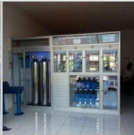
Desain Etalase (2)