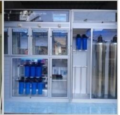
Desain Etalase (21)