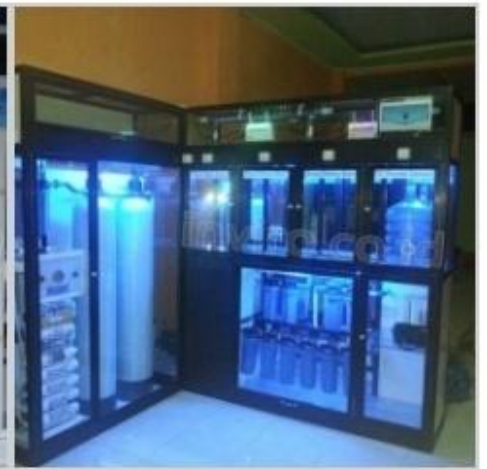
Desain Etalase (12)