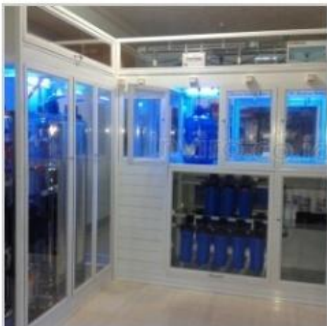
Desain Etalase (4)