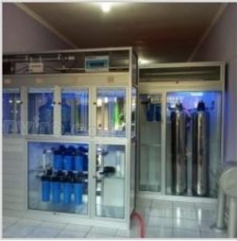
Desain Etalase (7)