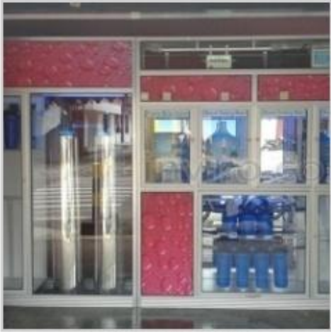
Desain Etalase (13)