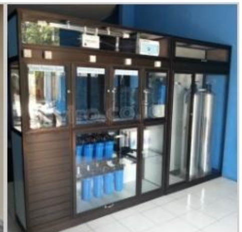
Desain Etalase (6)