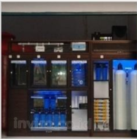
Desain Etalase (10)