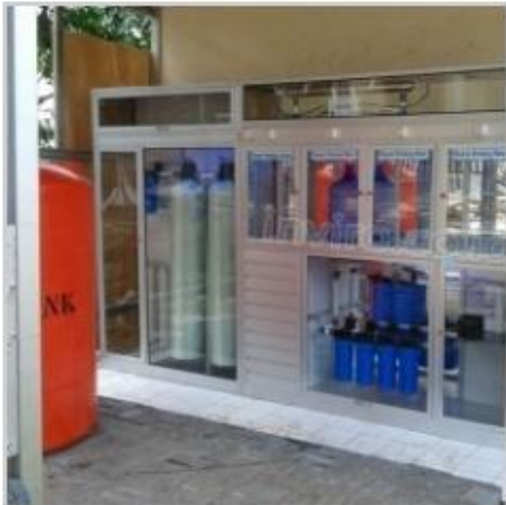
Desain Etalase (1)

Jika anda menghendaki resolusi gambar yang lebih besar, silahkan untuk menuju ke halaman website kami, tekan Ctrl + Klik DISINI >> http://inviro.co.id/desain-lemari-etalase-depot-air-minum-isi-ulang/