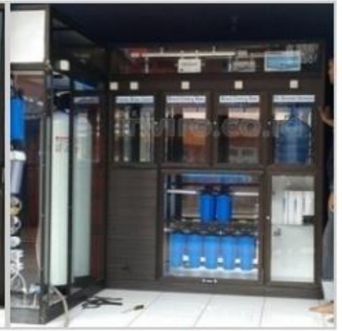
Desain Etalase (9)