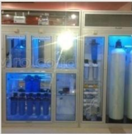
Desain Etalase (22)