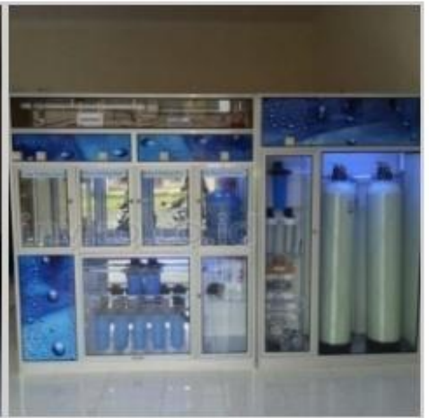
Desain Etalase (3)