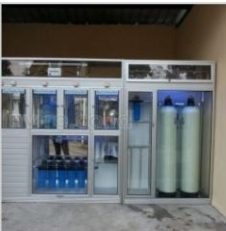
Desain Etalase (5)