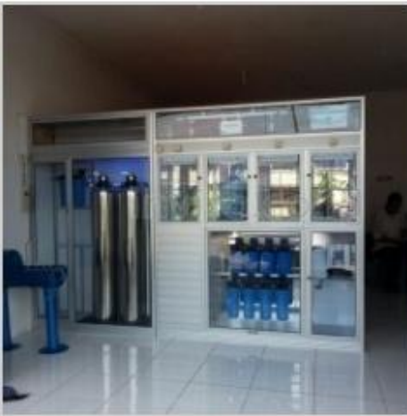
Desain Etalase (2)