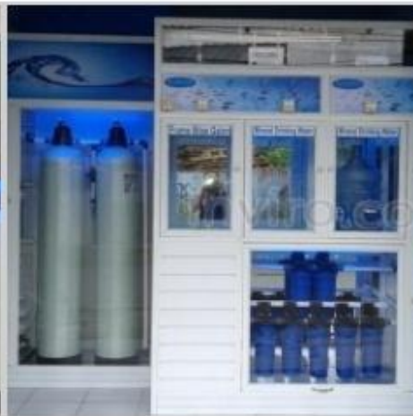
Desain Etalase (11)