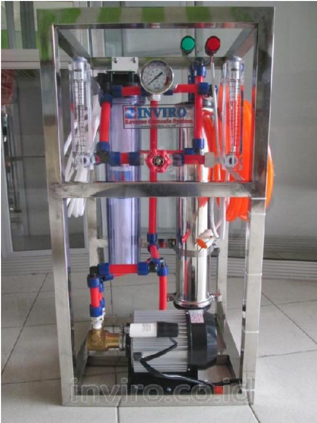
Gambar item no. 1 diatas, Unit Rangkaian Mesin RO (Reverse Osmosis) 1.000 GPD Vontron/CSM (Kapasitas Produksi Setara 200 Galon / Hari , 1 Galon = 19 Liter)