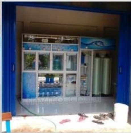
Desain Etalase (23)