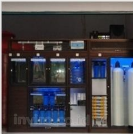
Desain Etalase (10)