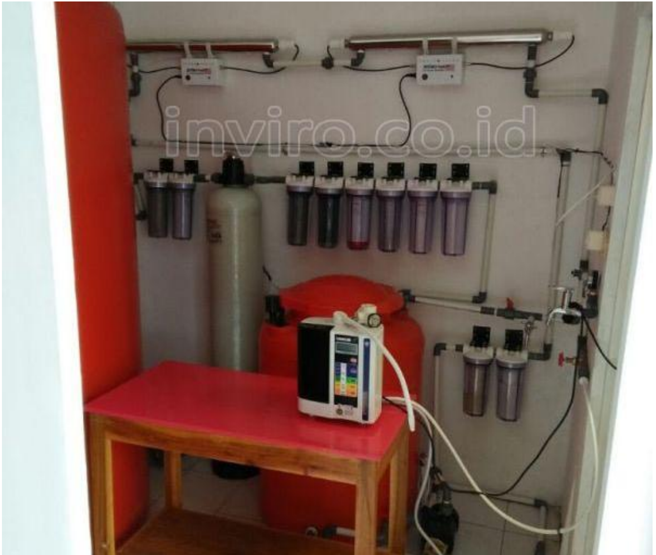
Foto-Foto Dokumentasi Pemasangan WTP Pre-Treatment untuk mesin KanGen Water yang sudah terpasang dilokasi user inviro dibawah ini ada yang sudah di custom sesuai permintaan ada yang sudah ditambah UV-nya menjadi dua, ada yang ditambah tabung media filternya menjadi tiga, ada juga yang masih sesuai dispek dipenawaran (menyesuaikan kondisi air baku dilokasi yang akan diolah)