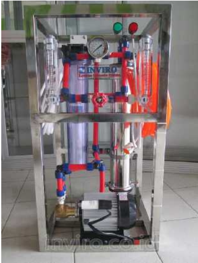
Gambar item no. 1 diatas, Unit Rangkaian Mesin RO (Reverse Osmosis) 1.000 GPD CSM Procon / Rotoflow (Setara 200 Galon / Hari, 1 Galon = 19 Liter)