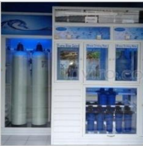
Desain Etalase (11)