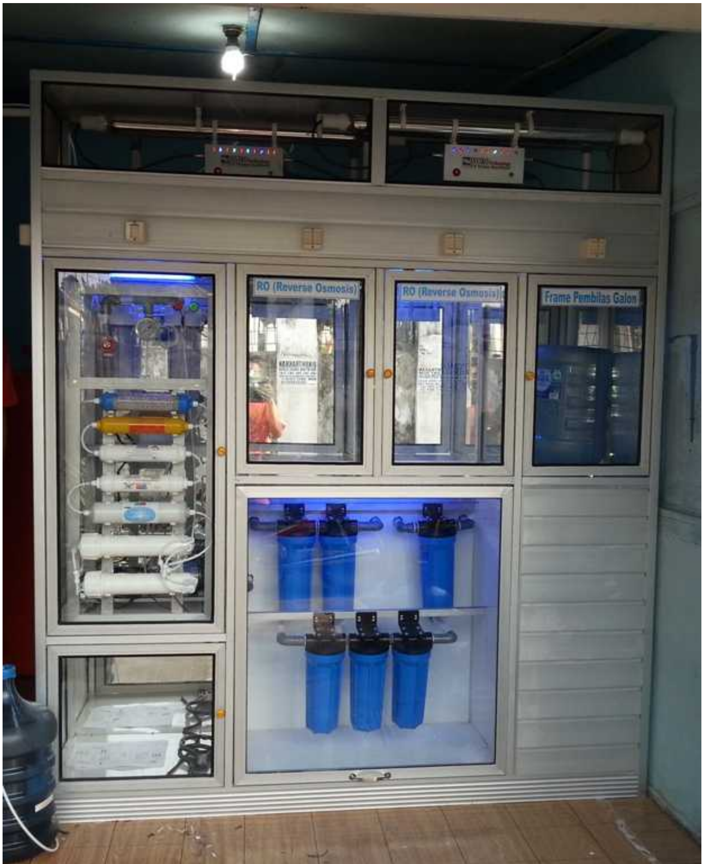
Gambar Desain Partisi Lemari Etalase, sesuai spek diatas