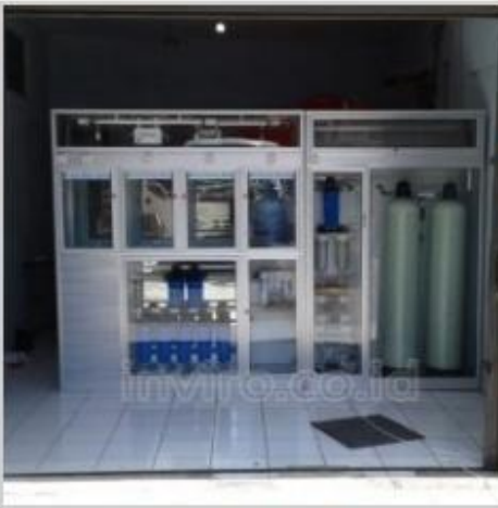
Desain Etalase (8)