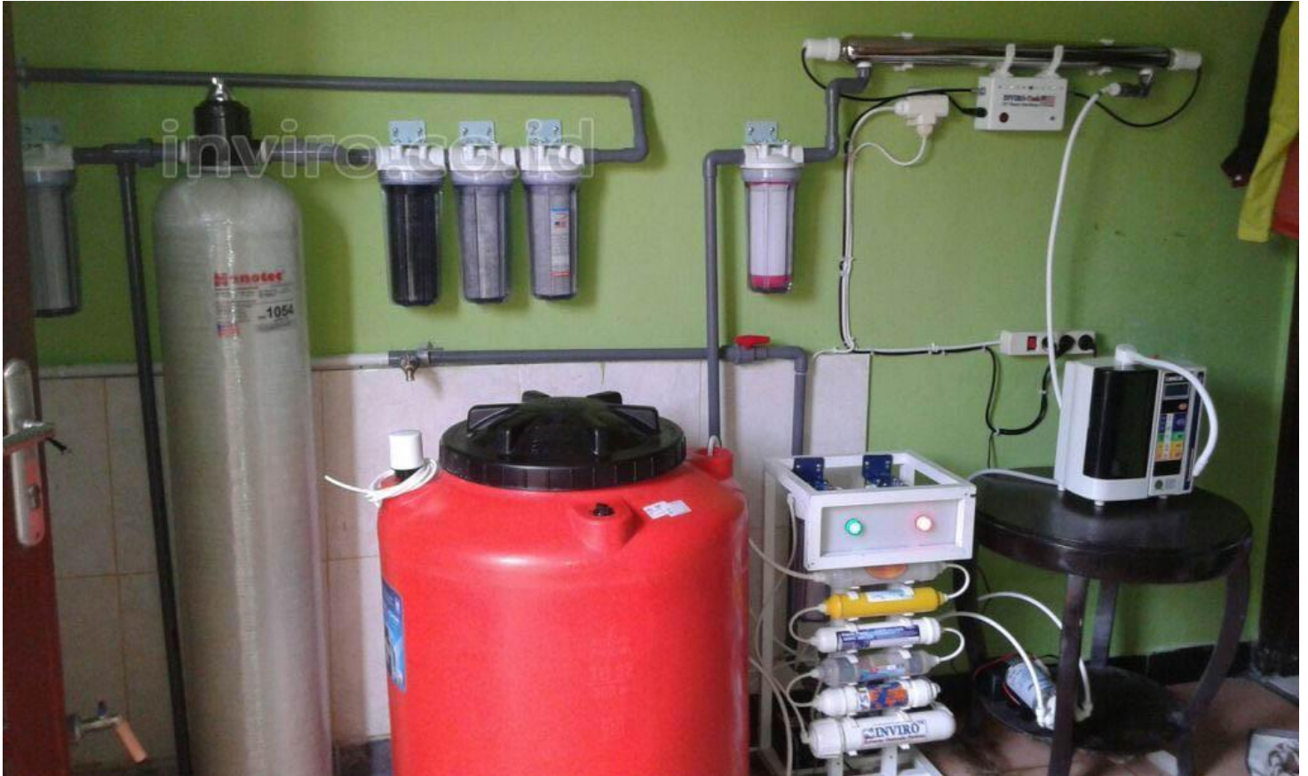
Foto-Foto Dokumentasi Pemasangan WTP Pre-Treatment untuk mesin KanGen Water yang sudah terpasang dilokasi user dibawah ini ada yang sudah di custom sesuai permintaan ada juga yang masih sesuai spek dipenawaran (menyesuaikan kondisi air baku dilokasi yang akan diolah)